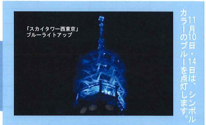
「スカイタワー西東京」 ブルーライトアップ

*当日14時45分より、西東京糖尿病療養指導士 による糖尿病を学ぶ企画もございます。 是非ご参加ください。